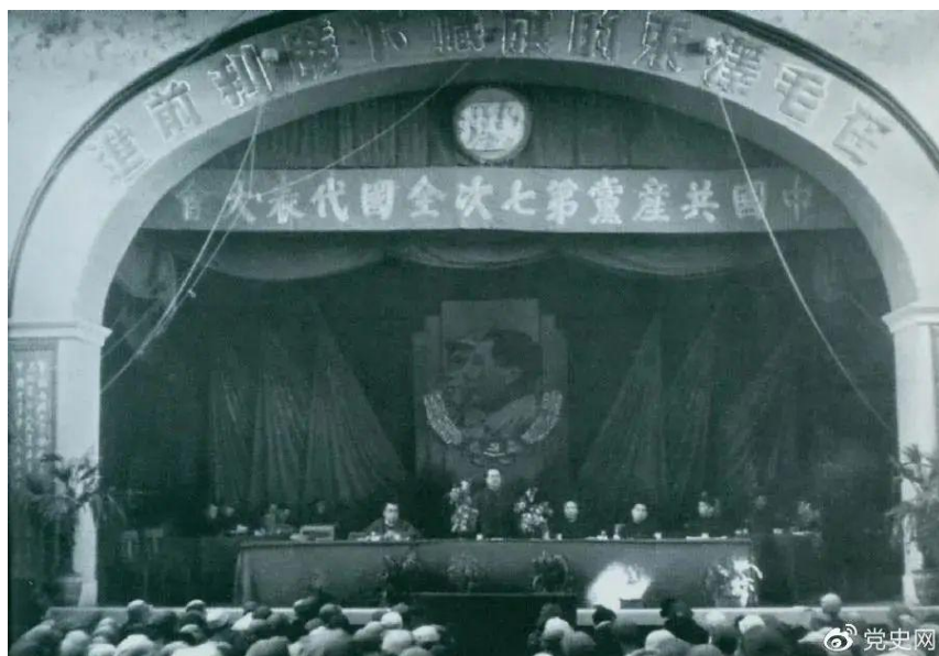
1945年4月23日，中国共产党第七次全国代表大会在延安举行。