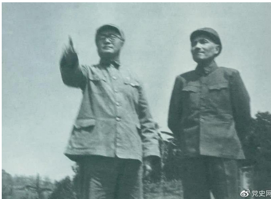
图为刘伯承司令员和邓小平政委指挥渡江准备工作。