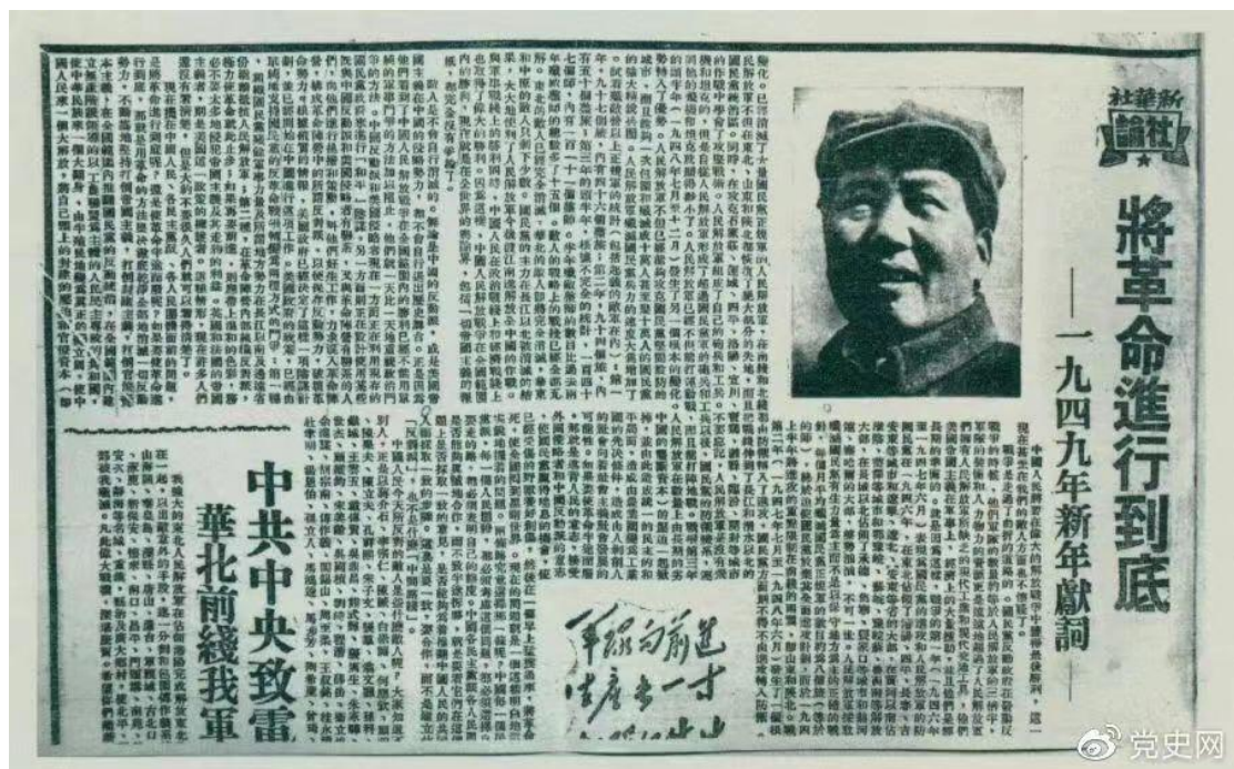
图为《人民日报》发表的毛泽东撰写的一九四九年新年献词《将革命进行到底》。