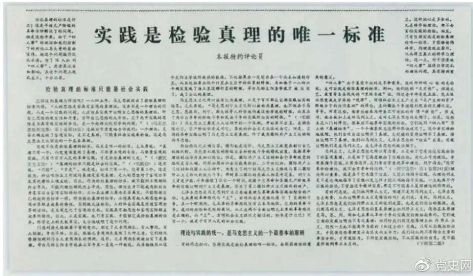
图为《光明日报》以特约评论员的名义公开发表《实践是检验真理的唯一标准》一文。