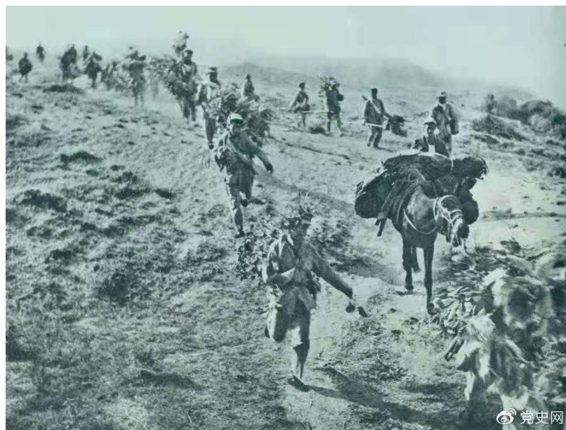
图为 1947 年 5 月在孟良崮战役中，华东野战军向孟良崮挺进。