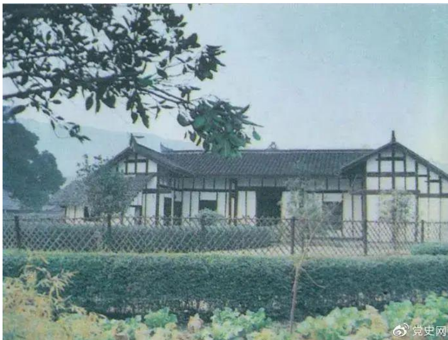
图为毛泽东、蔡和森、萧子升发起成立的新民学会旧址。