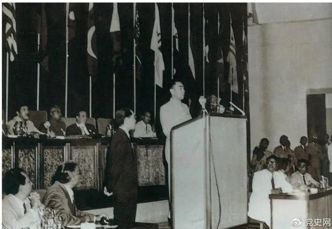
1955年4月18日，亚非会议在万隆开幕。图为19日周恩来在会议上发言。